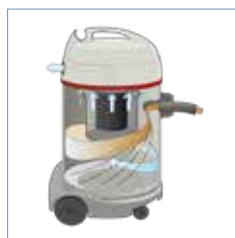
Patentiertes Wasser-Abscheide- system