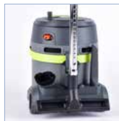
Parkierstation für Zubehör und Saugrohr