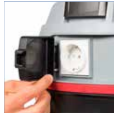
Steckdose am Gerät